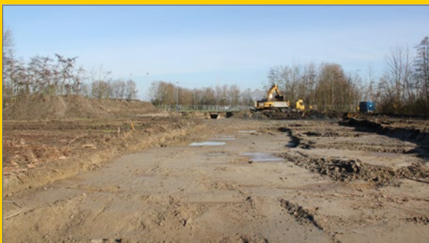
Grondsanering volkstuincomplex Kruiningen.