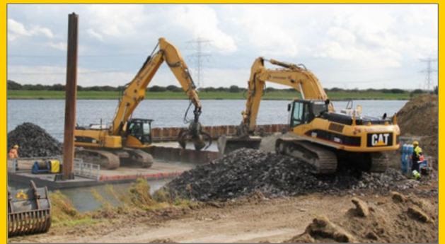
Aanleg windmolenpark Rilland (Kreekrak).