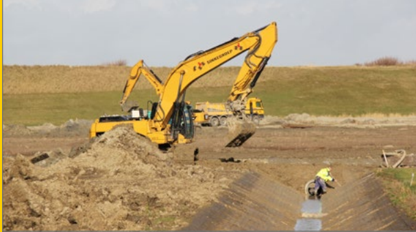
Aanleg natuurgebied Waterdunen Breskens.