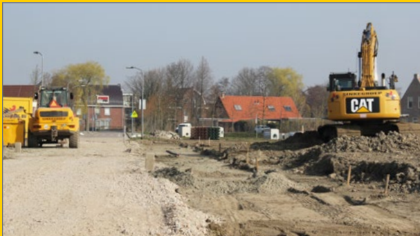
Aanleg woonwijk Dirksland.