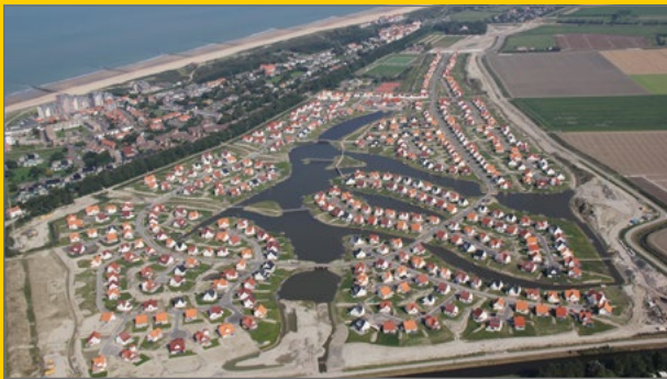
Aanleg villapark Cavelot sur mer Cadzand-Bad.