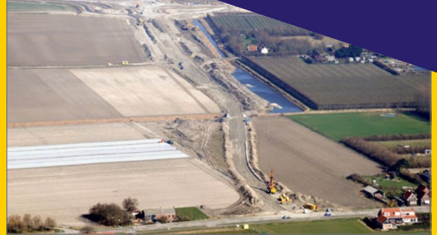
Aanleg rondweg Serooskerke.