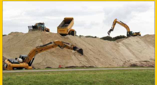
Dijkverzwaring Noorderstrand Renesse.