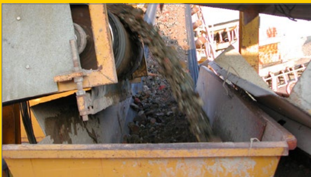
Aanvoer gebroken materiaal naar zeef.