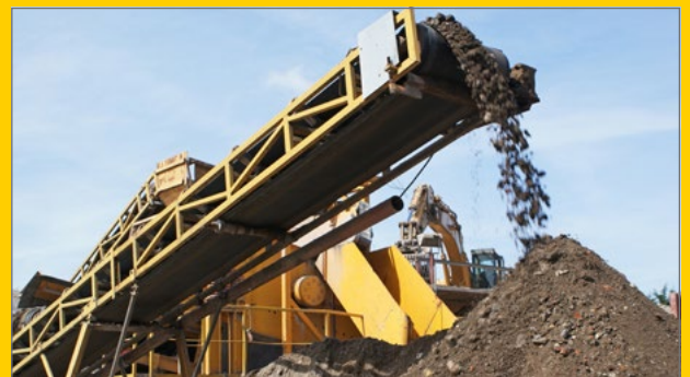
Op fractie uitgezeefd granulaat.