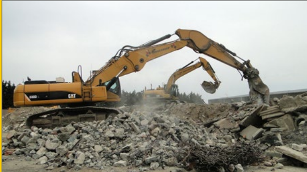
Voorverkleinen van grove puin.