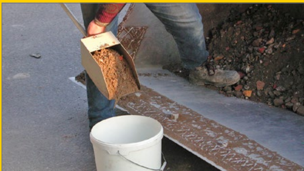
Monstername van granulaat.