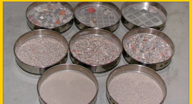
Toetsing granulaat aan de BRL 2506-norm.