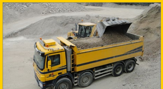
Afvoer gecertificeerd granulaat.