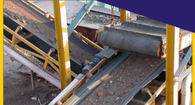
Ontijzeren d.m.v. magneetband.