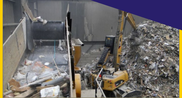
Het voeren van de soorteerlijn.