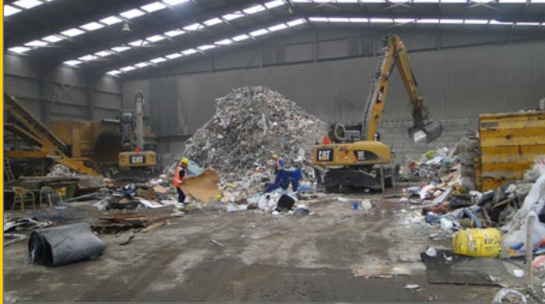
Ontvangst en grove voorsortering.