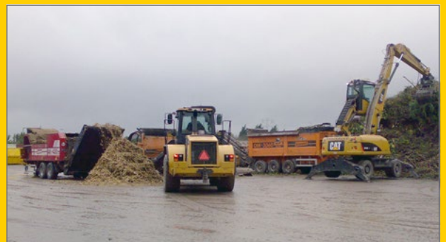
Bewerking hout- en groenafval tot bruikbare grondstoffen.

Sinke Recycling bv Nishoek 38a 4416 PE Kruiningen