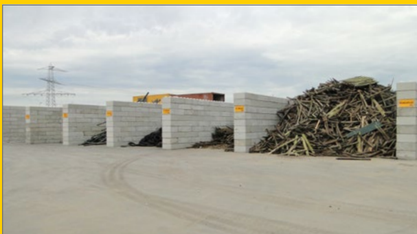
Opslag separate afvalstromen.