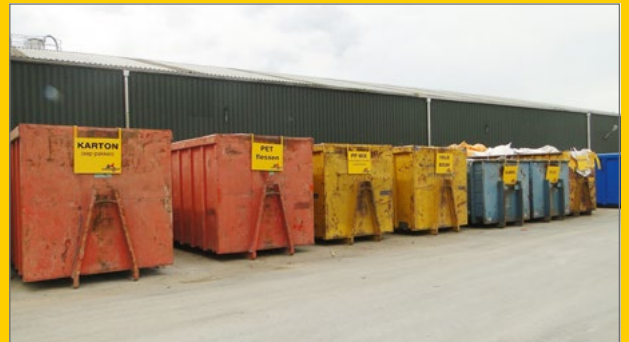
Afvoer gesorteerde afvalstromen.